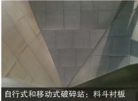
自行式和移动式破碎站：料斗衬板