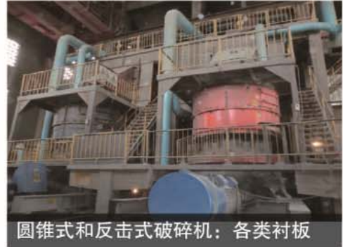
圆锥式和反击式破碎机：各类衬板