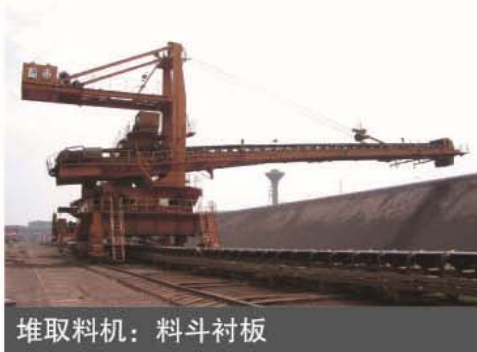
堆取料机：料斗衬板