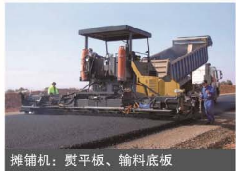
摊铺机：熨平板、输料底板