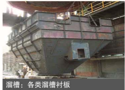
溜槽：各类溜槽衬板