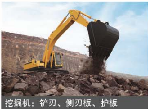
挖掘机：铲刃、侧刃板、护板