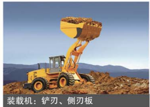
装载机：铲刃、侧刃板